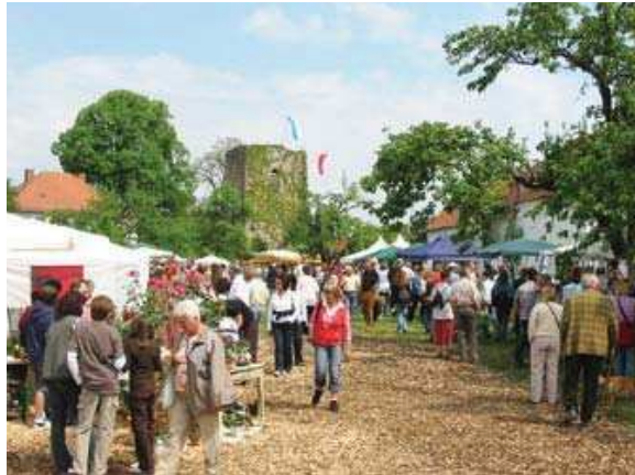
Handwerkermarkt in Großbreitenbronn

Neben den eigenen Dorferneuerungsprojekten werden die Dorferneuerungen Willendorf und Bammersdorf vorgestellt. Ansprechpartner aus den Ortsteilen stehen für Auskünfte zur Verfügung.